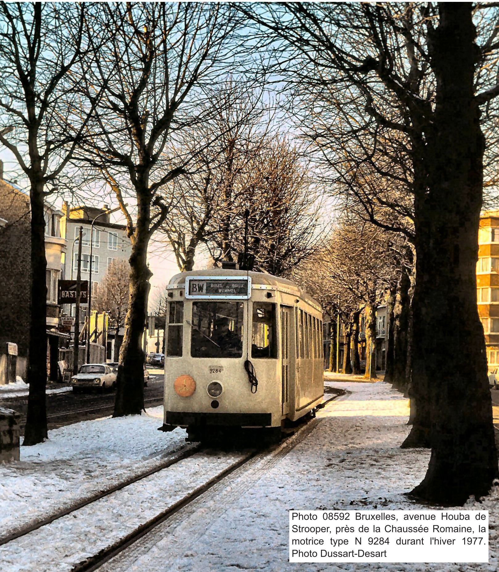
Photo 08592 Bruxelles, avenue Houba de Strooper, près de la Chaussée Romaine, la motrice type N 9284 durant l'hiver 1977.

E-mail : roland.dussart.desart@skynet.be